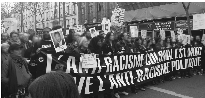
Marches du 19 mars Paris 2017 - © Crédit photo Manuel Boucher

Sous la direction de Manuel Boucher, la collection « recherche et transformation sociale » privilégie la publication d'ouvrages valorisant des résultats de recherche produits par des chercheurs des organismes de la formation et de l'intervention sociales pouvant contribuer à la transformation sociale.